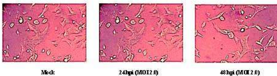
شکل ۱: سلول‌های A549 آلوده شده با ویروس آنفلوانزا H9N2 در غیاب تریپسین در MOI=2 . علائم آسیب سلولی شامل بزرگ شدن و کنده شدن سلول‌ها پس از ۲۴ ساعت مشاهده می‌شوند (بزرگنمایی X ۲۰۰).

سلول‌های زنده مشابه هم است، در حالی که در سلول‌های آلوده شده با دوز بالا و در حضور تریپسین درصد سلول‌های زنده به‌طور معنی‌داری ( p < 0.05 ) کاهش یافته بود.