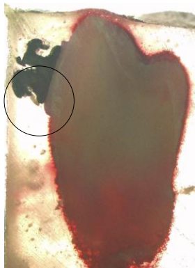
تصویر ۱: نمونه‌ای از ریزش رتبه ۰ در براکت فلزی

داده‌ها با استفاده از نرم‌افزار Spss ویرایش ۱۶ و آزمون‌های آماری Mann-Whitney و FISH exact تجزیه و تحلیل گردید.