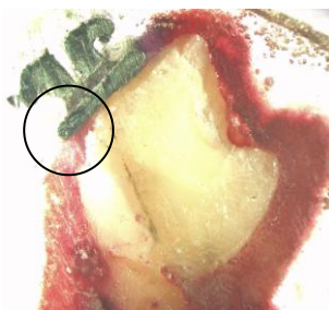
تصویر ۳: نمونه‌ای از ریزش رتبه ۲ در براکت فلزی

بررسی نتایج به دست آمده نشان داد در تمامی گروه‌ها درجاتی از ریزش وجود دارد. توزیع فراوانی وضعیت ریزش در گروه‌های مورد مطالعه در جدول ۱ نشان داده شده است. نتایج آزمون Mann-Whitney نشان داد میانه ریزش برحسب نوع کامپوزیت معنی‌دار است و در کامپوزیت بیس سایلوران به طور معنی‌داری کمتر است ( p=0/007 ) (جدول ۱). همچنین نتایج آزمون Mann-Whitney نشان داد میانه ریزش برحسب سطح باند شونده هم معنی‌دار بوده و ریزش بین براکت-ادهزیو بیشتر از میزان ریزش بین ادهزیو-مینا است ( p=0/025 ) (جدول شماره ۱).