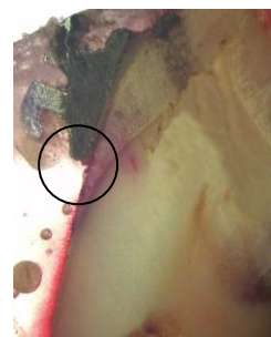
تصویر ۴: نمونه‌ای از ریزش رتبه ۳ در براکت فلزی