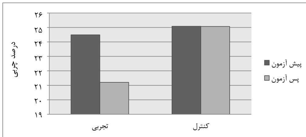
نمودار ۳: مقایسه تغییرات درصد چربی در گروه تجربی و کنترل قبل و بعد از دوره تمرین