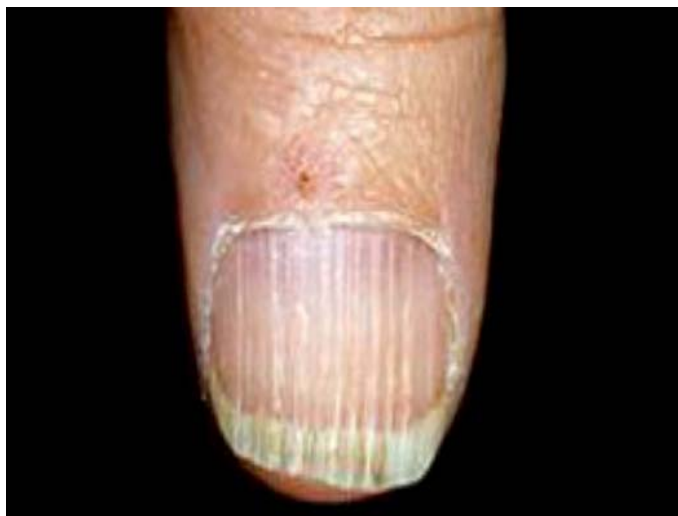
شکل ۳: بروز لکه‌های سفید و خط‌های طولی روی سطح ناخن متداول‌ترین علامت مسمومیت مزمن با سلیوم