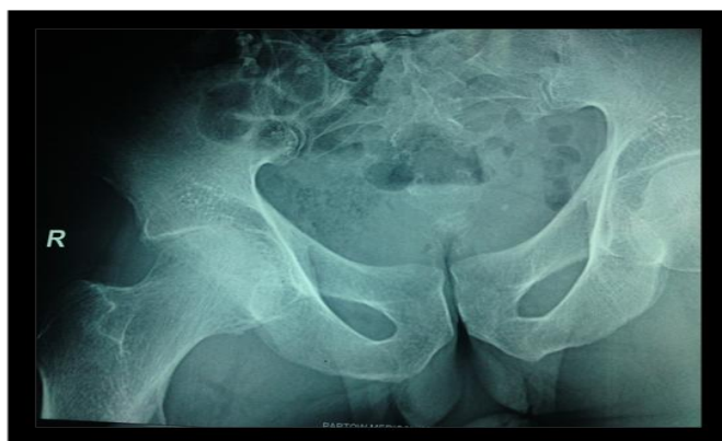
شکل ۲: Plain radiography of pelvis

در بیمارستان ۲، آزمایشات آزمایشگاهی در بدو پذیرش CRP:3+, combs wright: 1/320, 2ME:1/160 بوده و در