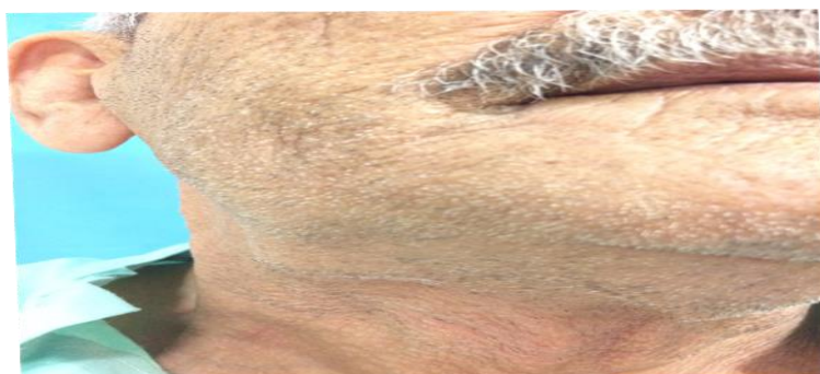
شکل ۱: تورم در ناحیه ساب مندیبلار راست

شده است. در استفاده از کتب و منابع مختلف مثل ترجمه متون یا مقالات رعایت حقوق ادبی و اصول اخلاقی در نظر گرفته شده است. با تصویب طرح در کمیته اخلاق و کسب کد اخلاقی، انجام این پژوهش صورت گرفته است. رضایت آگاهانه و داوطلبانه و کتبی (تمایل به تکمیل پرسشنامهها به عنوان رضایت ضمنی شرکت در مطالعه در نظر گرفته شده، مگر اینکه با