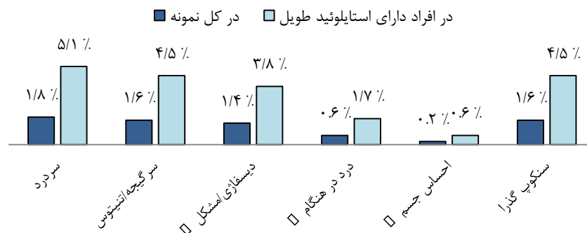
نمودار ۱: شیوع علائم در نمونه مورد مطالعه

کاروتید و تحریک اعصاب سمپاتیک جدار عروقی، فشار روی اعصاب منطقه، فیبروز متعاقب تونسیلکتومی که اعصاب زوج ۵، ۷، ۹، ۱۰ مغزی را درگیر می‌کند و شکستگی زائده استایلوئید متعاقب تروما که می‌تواند منجر به تشکیل بافت گرانولیشن و فشار روی ساختارهای اطراف شود (۲).