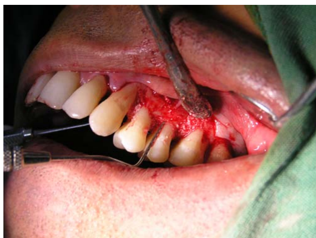
شکل (۳): نحوه اندازه گیری CEJ/BL به وسیله پروب ویلیامز

رادیوگرافی های هر بیمار بر روی نگاتسکوپ قرار داده شده و پس از قرار دادن کاغذ شفاف (Transparent) بر روی رادیوگرافی ها و ثابت کردن آن، CEJ دندانها در سطوح مزیال و دیستال و سطح ستیغ استخوان آلوئول علامت گذاری شد. سپس با استفاده از کولیس دیجیتالی مدرج ساخت ژاپن با دقت ۰/۰۱ میلیمتر، فاصله بین این دو نقطه به گونه ای که خط کش از CEJ عمود بر ستیغ استخوان باشد، با دقت صدم میلی متر اندازه گیری شد و در فرم اطلاعاتی بیمار ثبت گردید. بار دیگر با استفاده از ذره بین تمامی اندازه ها توسط دو متخصص رادیولوژی بر روی رادیوگرافی و کاغذ شفاف بررسی شدند. در مورد رادیوگرافی