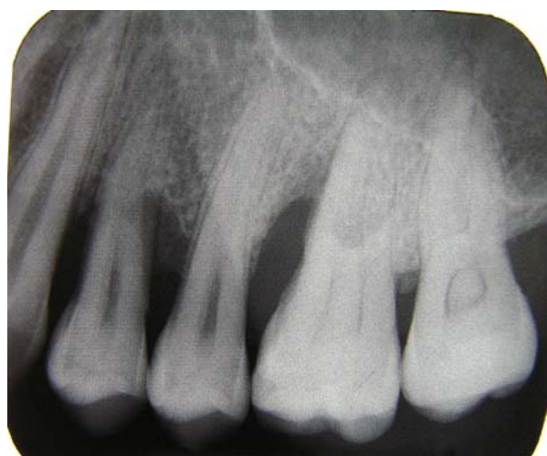
شکل (۱): رادیوگرافی پری اپیکال موازی با فیلم نگهدار XCP

عمل جراحی در بخش پرودنتولوژی دانشکده دندانپزشکی انجام گرفت. پس از انجام مراحل مقدماتی و دادن برش (Full thickness flap) بافت لثه از روی دندان و استخوان کنار زده شده و پس از جرم گیری و تمیز کردن محل، بدون اینکه صدمه و تغییر در استخوان ایجاد گردد، توسط پروب پرودنتال ویلیامز فاصله بین CEJ دندان تا سطح ستیغ استخوان آلوئول در سطح مزیال و دیستال دندانهای ۵ و ۶ و ۷ به شرط اکسپوز کردن هر کدام از این سطوح توسط جراح، به گونه ای که پروب از CEJ عمود بر ستیغ استخوان باشد، توسط جراح اندازه گیری شد. شایان ذکر است که فاصله ثبت شده در فرم مربوط به بالاترین سطح ستیغ در سمت باکال یا لینگوال بود که در کلیشه رادیوگرافی به عنوان سطح استخوان آلوئول در نظر گرفته می شود و این اندازه در فرم اطلاعاتی بیمار ثبت گردید (تصویر ۳).