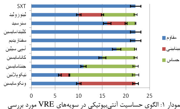
نمودار ۱: الگوی حساسیت آنتی‌بیوتیکی در سویه‌های VRE مورد بررسی