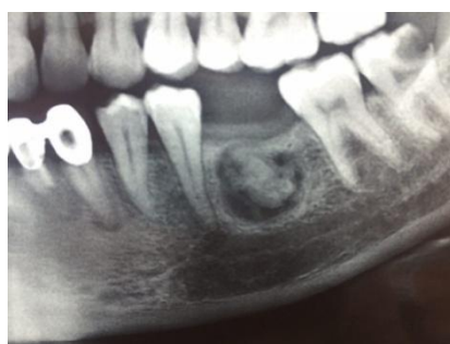
تصویر ۱: نمای پانورامیک ضایعه قبل از جراحی

در نمای بالینی تورم مختصر دردناک در سمت چپ مندیبل مشاهده گردید. مخاط دهان کاملاً سالم بود. بیمار تحت بیوپسی اکسیژنال قرار گرفت. بافت ارسال شده به آزمایشگاه حاوی چندین قطعه بافت نرم و سخت به رنگ کرم-قهوه‌ای در ابعاد ۲۵×۷×۵mm بود. بافت‌های نرم و سخت به ترتیب در محلول‌های فرمالین ۱۰٪ و اسید نیتریک قرار داده شدند.