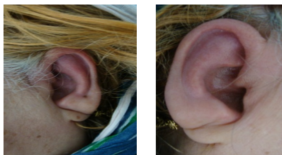
شکل ۲: التهاب غضروف گوش بدون درگیری نرمه گوش

بیمار سابقه فشار خون از ده سال قبل داشته و تحت درمان با هیدروکلروتیازید بوده است. بیمار دیابتیک نبوده است. در معاینه بیمار تب خفیف (۳۷/۷ دهانی) به همراه قرمزی و حساسیت هر دو گوش (بدون درگیری نرمه گوش) و غضروف بینی، قرمزی و سوزش چشم‌ها داشت. سمع ریه‌ها پاک و معاینه قلب نرمال بود. معاینه مفاصل محیطی و محوری نرمال بوده ولی حساسیت در لمس غضروف‌های کوستوکندرال داشت. معاینه چشم پزشکی نشان دهنده قرنیته‌های شفاف، ملتحمه محتقن، که مطابق با تشخیص اپی اسکریت بود. شواهدی به نفع یوئیت نداشت، شبکیه و سگمان قدامی و خلفی نرمال بود. در معاینه گوش التهاب در غضروف گوش دیده ولی پرده تمپان نرمال بود. بررسی ادیومتری نشان دهنده کاهش شنوایی حسی عصبی گوش چپ بود (نمودار ۱).