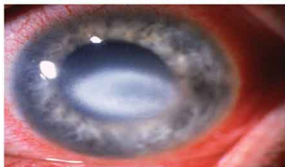
شکل (۲): نامنظمی اپی تلیوم قرنيه