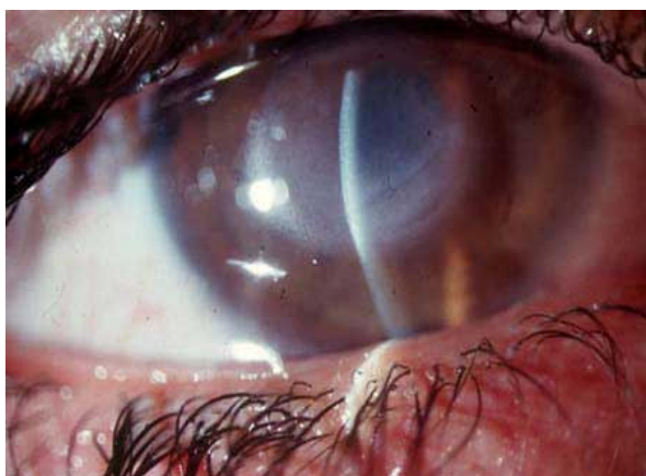
شکل (۱): انفیلتراسیون عمیق استروما

به melting و پرفوراسیون نمود. برای بیمار بطور اورژانس پیوند قرنيه انجام گرفت پس از مدتی بیمار به گلوکم ناشی از التهاب مزمن مبتلا شد و دو مرتبه تحت جراحی ترابکولکتومی برای گلوکم قرار گرفت. در آخرین پیگیری علیرغم شفاف بودن قرنيه به علت آتروفی عصب اپتیک ناشی از گلوکم و کاتاراکت دید بیمار انگشت شمارش ۱۰ سانتی متری است و هنوز تحت درمان داروهای آنتی گلوکوما برای کنترل فشار چشم می باشد.