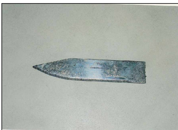
شکل 2: تیغه چاقو بعد از خارج شدن از قلب بیمار

بیمار خانم 36 ساله ای است که حدود یک سال قبل به دنبال نزاع با همسرش مورد اصابت ضربه چاقو در طرف راست قفسه صدري در فضای بین دنده ای پنجم در خط پاراسترنال قرار گرفته است و پس از اعزام به بیمارستان در بخش جراحی بستری گردیده و زخم پوست بیمار به صورت ساده ترمیم و بعد از 12 روز مرخص شده است. پس از ترخیص حدود یک ماه درد شدید ناحیه قفسه صدري داشته و بعد از آن از شدت درد کاسته شده ولی به طور مداوم احساس درد خفیف ناحیه قفسه صدري را داشته و در زمان فعالیت دچار تنگی نفس می شده است. همچنین هنگام خوابیدن به پهلو راست و پشت شدت درد افزایش یافته و تنها قادر به خوابیدن به پهلو چپ بوده