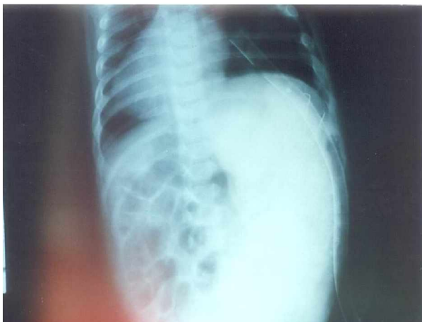
شکل 1: ب

شکل 1: الف و ب- رادیولوژی ساده شکم که فکالوم بزرگی را در طرف راست شکم نشان می‌دهد. Chest tube پس از عمل شنت Boot Shaped گذاشته شده است.