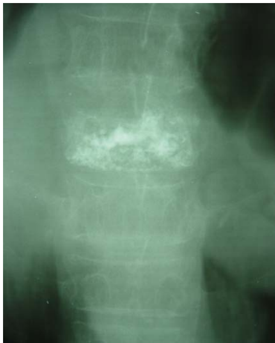
شکل ۱-۲: بعد از عمل در حالت رخ

بیمار مردی ۷۲ ساله که به دلیل کمردرد شدید موضعی در قسمت تحتانی سینه ای و کمری از ۸ ماه قبل، با تشدید پس از فعالیت و غیرانتشاری مراجعه کرده بود. در معاینه فیزیکی، لمس مهره های قسمت تحتانی سینه ای و کمری حساس بود سایر معاینات طبیعی بود. بررسی های آزمایشگاهی طبیعی بود و در رادیوگرافی به عمل آمده شکستگی به دلیل پوکی استخوان در مهره های L2 و L4 داشته است و در MRI انجام شده موارد فوق به تایید رسید. (عکس های ۱ و ۲). درد بیمار به درمانهای محافظه کارانه از قبیل کمربند، دارو، استراحت و فیزیوتراپی جواب نداده است. بیمار با تشخیص شکستگی پاتولوژیک استئوپروتیکی با بیهوشی عمومی تحت درمان ورتبروپلاستی قرار گرفت و ضمن این پروسه با سوزن شماره ۱۸ تحت کنترل فلوروسکوپی وارد پدیکل مهره و سپس وارد تنه مهره شدیم و وضعیت سوزن را با رخ و نیمرخ کنترل کردیم سپس یک تا دو سی سی سیمان استخوانی به داخل تنه مهره تحت کنترل فلوروسکوپی تزریق کردیم. پس از ۲۴ ساعت در حالی که از درد شکایت نداشت و بدون دستور دارویی از بیمارستان ترخیص گردید. در پیگیری به عمل آمده بعد از ۴ ماه بیمار همچنان در ناحیه شکستگی قبلی بدون درد است.