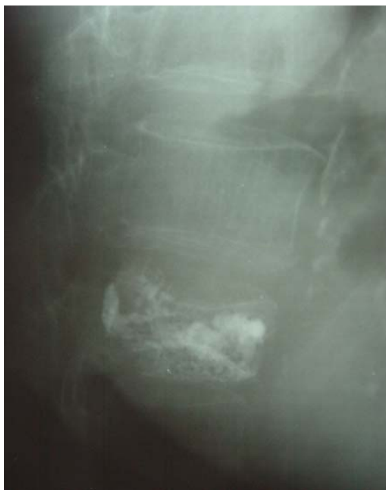
شکل ۲-۲: بعد از عمل در حالت نیم رخ