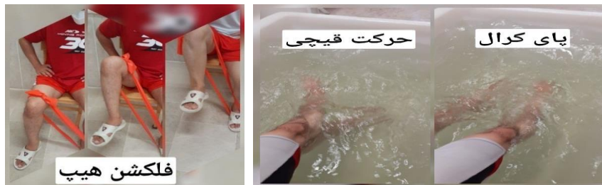
شکل ۲: نمونه‌ای از تمرینات گروه تمرین با تراباند و تمرین در آب