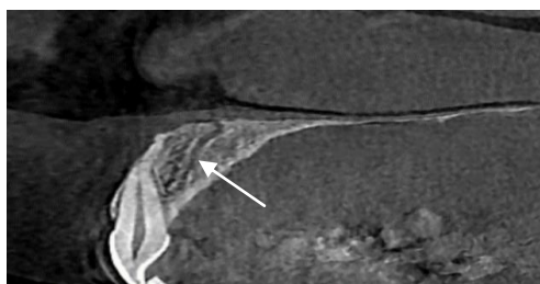
شکل ۱: در نمای CBCT کات ساژیتال، کانال AC در پالاتال دندان که تا انتهای تحتانی ریج امتداد یافته (فلش)

سنی ۲۰-۸۰ سال، مشخص شد که CS با بیشترین شیوع در کورتکس باکال ناحیه بین اینسیزور سنترال و اینسیزور لترال قرار دارد. هم‌چنین این محققین به ارتباط معناداری بین شیوع این کانال در سمت راست و سمت چپ دست نیافتند. نکته جالب توجه این است که علی‌رغم اینکه در این مطالعه تصاویر تنها در مقطع