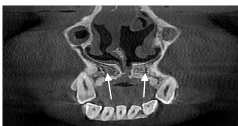
شکل ۲: در نمای CBCT کات کرونال، کانال CS که از ۲ سمت نازل فوسا به سمت قدام ریج آلوئول گسترش یافته (فلش‌ها)