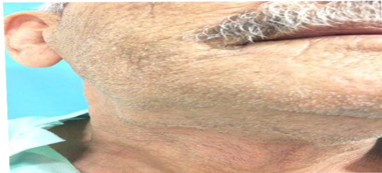
شکل ۱: تورم در ناحیه ساب مندیبلار راست

شده است. در استفاده از کتب و منابع مختلف مثل ترجمه متون یا مقالات رعایت حقوق ادبی و اصول اخلاقی در نظر گرفته شده است. با تصویب طرح در کمیته اخلاق و کسب کد اخلاقی، انجام این پژوهش صورت گرفته است. رضایت آگاهانه و داوطلبانه و کتبی (تمایل به تکمیل پرسشنامه‌ها به‌عنوان رضایت ضمنی شرکت در مطالعه در نظر گرفته شده، مگر اینکه با