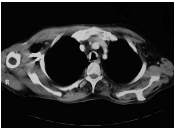
شکل ۱: نمای سی تی اسکن TO

فیبراپتیک قرار گرفته که ضایعات ندولار سفید رنگ با قوام سفت در طول تراشه و برونش‌های اصلی مشاهده شد (شکل ۲) از یک ندول بیوپسی گرفته شد که یافته‌های بافت‌شناسی به طور تیبیک ندولهای غضروفی و استخوانی بوده که در ساب موکوس قرار دارند (شکل ۳). بیمار با تشخیص TO برای لیزر درمانی انتخاب شد.