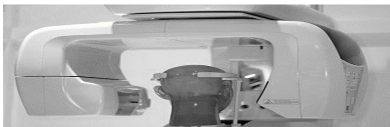
شکل ۳: سیستم ترموگرافی کامپیوتری با بیم مخروطی به همراه فانتوم سر و گردن

می‌دهد. قرص‌های TLD که در دوزیمتری CBCT نیز استفاده می‌شوند، اغلب از ترکیب LiF ساخته شده و مزیت این TLDها این است که ترکیبی معادل بافت دارند و در نتیجه دوز جذب شده توسط آن‌ها شبیه به دوز بافت می‌باشد. این دوزیمترها محدوده ۱ میلی‌گری تا ۱۰ گری را اندازه‌گیری می‌کنند. TLD معمولاً دوز ناشی از ذرات X و بتا و گاما را اندازه‌گیری می‌کنند. پس از تابش TLD، خوانش آن را نباید بیشتر از چند روز عقب انداخت زیرا سیگنال ایجاد شده ضعیف شده و انرژی نهفته به مرور زمان آزاد می‌شود (۲۱، ۲۰).