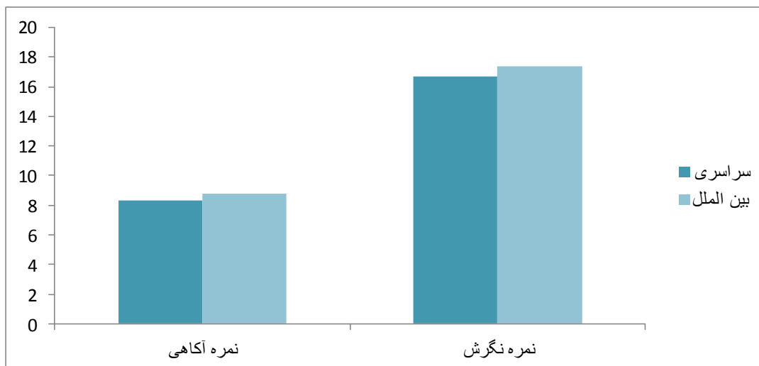
نمودار ۳: میانگین نمره آگاهی و نگرش فارغ التحصیلان دندانپزشکی یزد پیرامون آموزش ترمیم‌های کامپوزیت بر حسب نوع ورودی