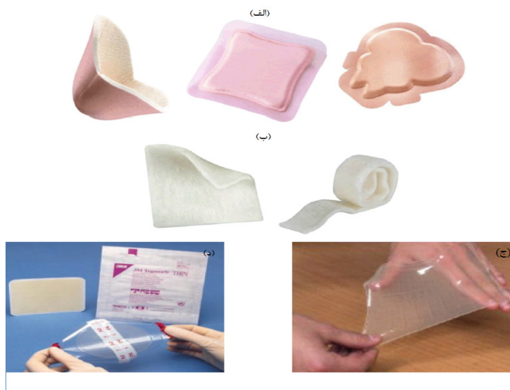
شکل ۳: الف) نمونه‌ای از پانسمان‌های زخم فومی در اندازه و شکل‌های مختلف؛ ب) نمونه‌ای از پانسمان‌های زخم آلژینات؛ ج) نمونه‌ای از پانسمان‌های زخم هیدروژلی؛ د) نمونه‌ای از پانسمان‌های زخم هیدروکلوئیدی (۹۲،۹۳)

ذره یا ورق، موجودند. آن‌ها ترشحات زخم را جذب می‌کنند تا یک ژل نرم زیست تخریب پذیر روی سطح زخم ایجاد شده و موجب حفظ رطوبت زخم شود (۸۴). اسید هیالورونیک (HA) یک جزء گلیکوآمینوگلیکان ماتریکس خارج سلولی (ECM) با ویژگی‌های بیولوژیکی و فیزیکی شیمیایی منحصر به فرد است. همانند کلاژن، HA نیز به طور طبیعی زیست سازگار، زیست تخریب پذیر و دارای قابلیت ایمنی‌زایی است (۸۵). کیتوسان نیز یکی از پلیمرهای زیست فعال است که باعث تسریع تشکیل بافت گرانوله در مرحله تکثیر از فرآیند بهبود زخم می‌شود (۸۶). خواص کیتوسان، اجازه اتصال آن به گلیبول‌های قرمز را داده و باعث لخته شدن و بند آمدن سریع خون می‌شود. همچنین این ماده در آمریکا برای استفاده در بانداژها و دیگر عوامل بند آورنده خون تأیید شده است (۸۷،۸۸). علاوه بر آن،