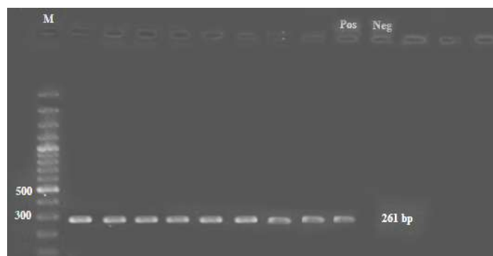
شکل ۱: ژل الکتروفورز محصولات PCR ژن blaVIM-1 بر روی آگاروز ۱٪ در کنار نشانگر استاندارد ۱۰۰ جفت بازی، M: نشانگر مولکولی، Neg: کنترل منفی و Pos: کنترل مثبت، بقیه نمونه‌ها هستند.

۸۴٪ درصد باکتری‌های مولد MBL مقاوم به ایمپنم و مروپنم بودند. از ۲۵ ایزوله سودوموناس آئروجینوزای مولد MBL (با روش فنوتیپی) ۸ باکتری (۳۲٪) ژن blaVIM-1 در آنها ردیابی شد (شکل ۱).