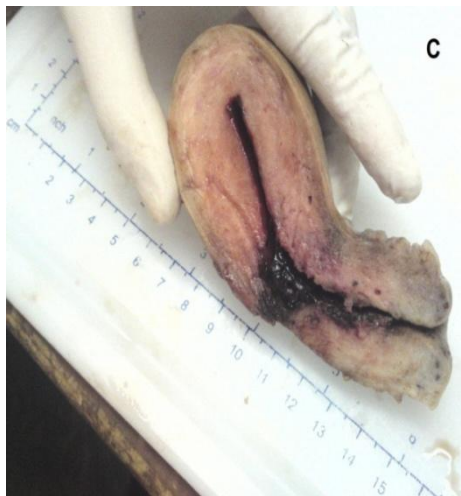
شکل ۲. نمای ماکروسکوپی (C) خوردگی جسم رحم در محل سگمان تحتانی مربوط به انسزیون سزارین قبلی

در بررسی ماکروسکوپی، رحم بدون ضمائم و جسم رحم به ابعاد ۳/۵×۵/۵×۵/۵ سانتی‌متر می‌باشد. در برش در پایین‌ترین قسمت جسم رحم (در محل برش سزارین قبلی) لخته خون و نازک شدگی جدار رحم وجود داشت (شکل ۲) که در برش