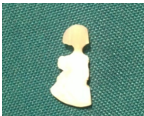
شکل ۱: نمونه آماده شده به صورت ساعت شنی

که شکست بین کامپوزیت و عاج ایجاد شد. سپس نیروی شکست بر حسب واحد مگاپاسکال ثبت و پس از دسته‌بندی و کدگذاری توسط رایانه و با استفاده از آزمون‌های آماری Anova, Tukey HSD, T test, Two-way Anova, Post hoc test, تحلیل گردیدند.