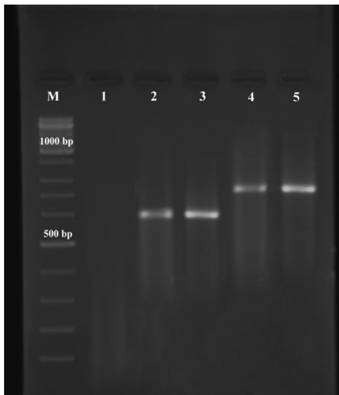
شکل ۲: محصول ژن تکثیر شده ITS-rDNA لیشمانیا میجر و لیشمانیا تروپیکا جدا شده از بیماران مبتلا به لیشمانیوز جلدی (M: مارکر، چاهک ۱: کنترل منفی، چاهک ۲: سویه استاندارد لیشمانیا میجر، چاهک ۳: لیشمانیا میجر جدا شده از بیمار جلدی، چاهک ۴: سویه استاندارد لیشمانیا تروپیکا، چاهک ۵: لیشمانیا تروپیکا جدا شده از بیمار جلدی)

متفاوت در میان گونه‌های مختلف لیشمانیا می‌شود. بر این اساس توالی حاصل از تکثیر این محدوده ژنی در لیشمانیا میجر اندازه‌ای حدود ۶۰۰ bp و در لیشمانیا تروپیکا حدود ۷۵۰-۸۰۰ bp دارد و بدین ترتیب این دو گونه انگل از یکدیگر متمایز می‌گردند (شکل ۲).