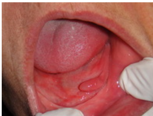
تصویر ۱: نمای داخل دهانی یک ضایعه اگزوفیتیک Sessile به شکل مخروطی با سطح صاف و هم‌رنگ مخاط در سمت چپ کف دهان را نشان داد.

خانمی ۵۵ ساله به دلیل وجود یک ضایعه برجسته در سمت چپ کف دهان به بخش بیماری‌های دهان دانشکده دندانپزشکی شهید صدوقی یزد ارجاع شده بود. ضایعه مذکور توسط دندانپزشک عمومی در زمان قالب گیری از فک پایین جهت ساخت پروتز کامل مشاهده شده و بیمار را جهت بررسی و برداشت ضایعه مذکور به بخش بیماری‌های دهان و فک و صورت دانشکده دندانپزشکی ارجاع داده بود (تصویر ۱).