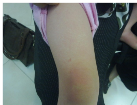
تصویر (۳): ضایعات ماکولار در اندام تحتانی