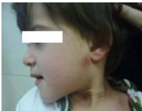
تصویر (۲): ضایعه بزرگ با حاشیه قرمز در صورت

ضایعات دور دهان (Circum Oral Pallor)، زبان قرمز توت‌فرنگی و فارنژیت اگزوداتیو که پاسخ خوبی به درمان با پنی