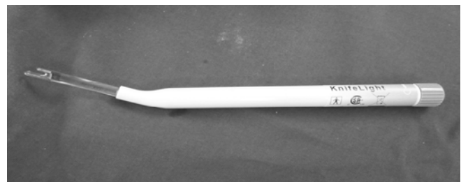
شکل ۲: ابزار جراحی نایف لایت (Stryker Co)

آزاد و سطح زیرین نیز با استفاده الواتور Freer از سینیوم آزاد می‌گردید. نوک U شکل ابزار جراحی (شکل ۲) روی لبه دیستال ۲/۳ باقیمانده لیگامان عرضی کارپال قرار داده می‌شد و در امتداد منطقه امن (۷) و تا حد چین پروکسیمال عرضی مچ دست به جلو هدایت می‌گردید. هنگام خارج کردن ابزار از روشنایی (Illumination)، تیغه آن برای کنترل قطع کامل TCL استفاده می‌شد (لازم به توضیح است که نوک این ابزار جراحی علاوه بر وجود یک چاقو که مسئول بریدن TCL می‌باشد با کمک یک باتری و ایجاد روشنایی قادر به ارزیابی ضخامت بافت نرم در موضع نیز می‌باشیم).