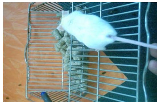
تصویر (۲) از گروه شاهد مثبت(تحت درمان با پارامیو).