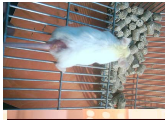
تصویر (۱) از گروه شاهد منفی (بدون هیچگونه درمان).