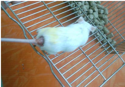
تصویر (۳) از گروه مورد(تحت درمان با انگبین).