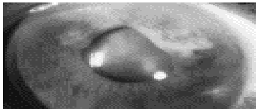
شکل ۲: نمای تومور مولتی ندولر پس از رادیوتراپی