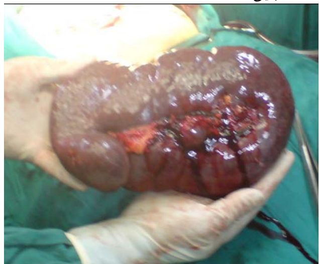
تصویر ۱- نمای اسپلنومگالی که دانه های زرد رنگ در سطح طحال را نشان می دهد

اکوژنیسته پارانیشیم طبیعی بود. به طوری که در سونوگرافی، اسپلنومگالی (به ابعاد ۲۸، ۱۶، ۱۰) گزارش شد. در آندوسکوپ، اولسردنودنوم گزارش شد. با توجه به آنمی نورموکروم نورموسیتیک و رتیکولوسیت پائین و ESR بالا با احتمال بدخیمی های هماتولوژیک، بیوپسی و آسپیراسیون مغز استخوان انجام گرفت که در گزارش میکروسکوپی، هیپرپلازی اریتروئید با انوزینوفیلی خفیف مشاهده شد. بیمار تحت جراحی اسپلنکتومی قرار گرفت (تصویر ۱) که در نمای ماکروسکوپی، کپسول خاکستری رنگ و سطوح برش خاکستری-قهوه ای بود و کبد دارای تغییرات شبیه به دانه های چربی بود. لازم به ذکر است که بیوپسی به هنگام جراحی تهیه شد. در گزارش پاتولوژی بیوپسی طحال و کبد، Granulomatous inflammation بدون نکروز کازئیفیه دیده شد و اثری از بدخیمی گزارش نگردید. با توجه به این نتایج و گزارش بیوپسی و آسپیراسیون مغز استخوان، نتیجه و تشخیص نهایی، ضایعات گرانولوماتوز بدون نکروز کازئیفیه مطابق با علائم سارکوئیدوز بود. پس از تشخیص، بیمار تحت درمان با پردنیزولون ۱ mg/kg/daily به مدت ۶ هفته قرار گرفت و سپس دوز دارو طی چند ماه به تدریج کاهش یافت. بعد از اسپلنکتومی و با شروع کورتون علائم بالینی بر طرف شد و وزن بیمار افزایش یافت، CBC نیز نرمال و ESR به ۲۰ رسید. در حال حاضر بیش از یکسال از قطع استروئید می گذرد و بیمار بدون علامت بالینی است.